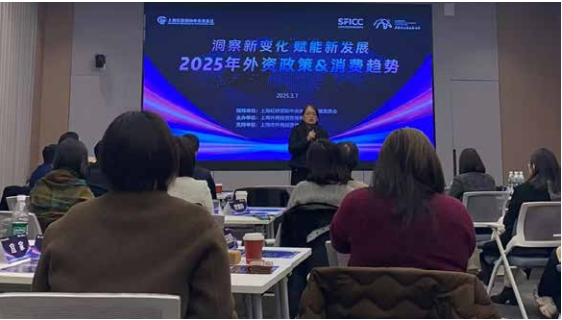
▲ 2025年3月27日 “洞察新变化 赋能新发展”外资政策和消费趋势