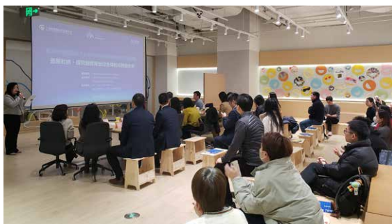
▲ 2025年1月17日 荟聚虹桥·探究创新商业综合体可持续未来