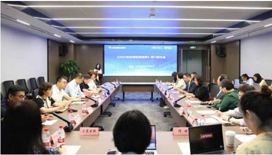
▲ 2025年9月24日 《2025世界投资报告》研讨会