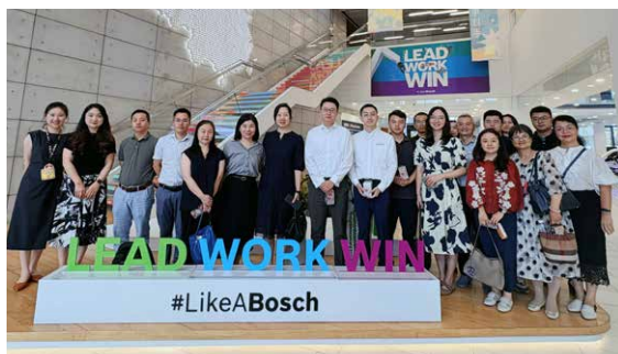
▲ 2025年9月5日 走进博世苏州灯塔工厂