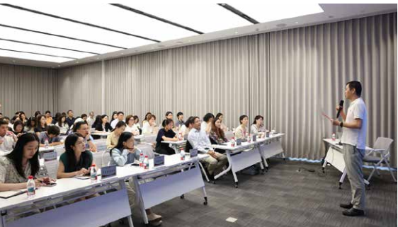
▲ 2025年7月15日 全市首场境外投资者以分配利润直接投资税收抵免等政策解读会