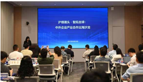
▲ 2025年8月29日 沪领潮头·智拓全球：中外企业产业合作出海沙龙