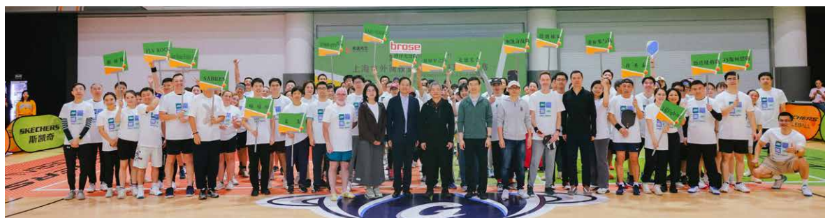
▲ 2024年11月16日 “虹桥杯”上海市外商投资企业匹克球友谊赛

为进一步参与虹桥国际开放枢纽建设，建立长三角外资企业服务生态，虹桥外企联谊会设立执行委员会。由上海市外商投资协会担任执行委员会主席单位，由毕马威中国、中国光大银行上海分行、上海段和段律师事务所、上海外服（集团）有限公司和上海外商投资咨询有限公司担任执委会成员，通过整合财税服务、金融服务、法律合规、人力资源、专业咨询五大维度的专业资源提升专业化服务能力。